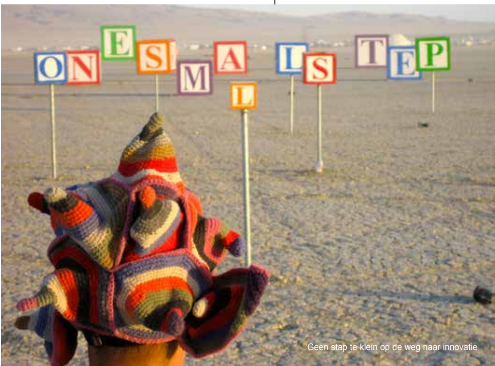
Geen stap te klein op de weg naar innovatie