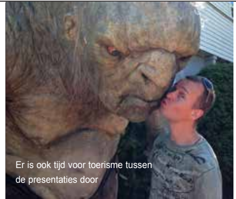
Er is ook tijd voor toerisme tussen de presentaties door